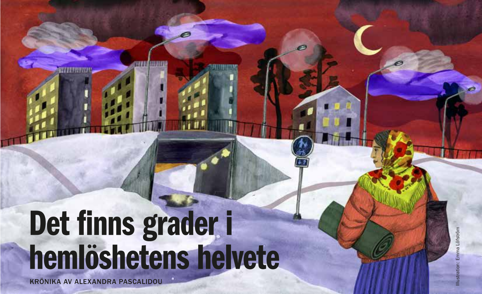
Illustration: Emma Löfström