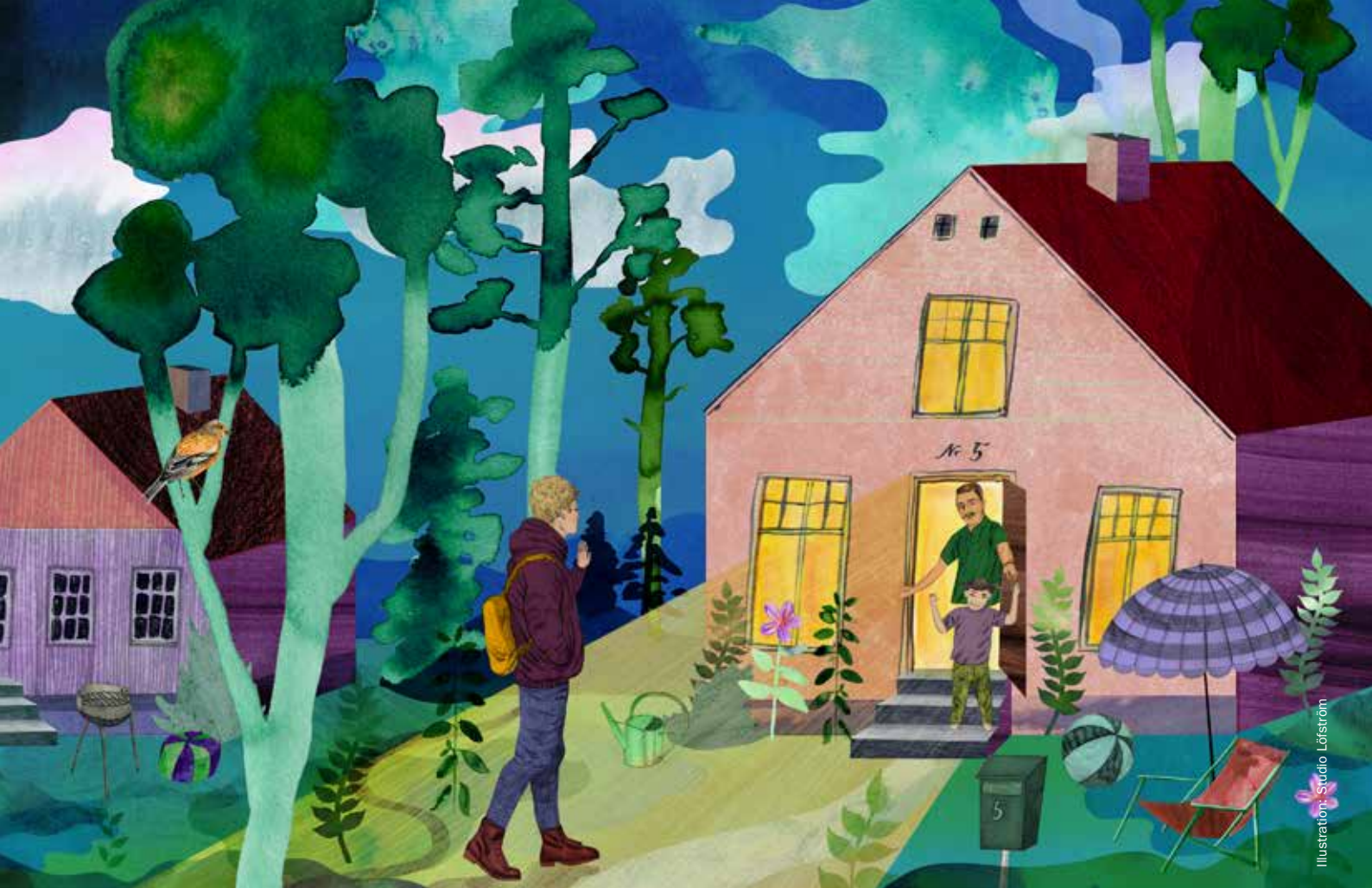
Illustration: Studio Löfström