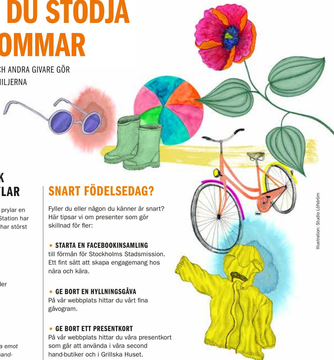
Illustration: Studio Lofström

TILLSAMMANS MED DIG OCH ANDRA GIVARE GÖR VI SKILLNAD FÖR BARNFAMILJERNA