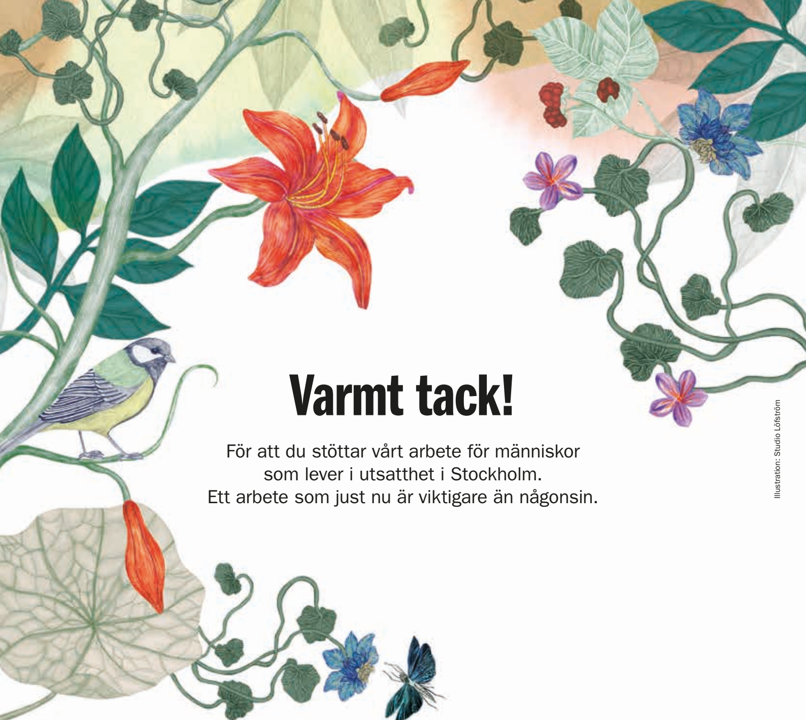
Illustration: Studio Löfström