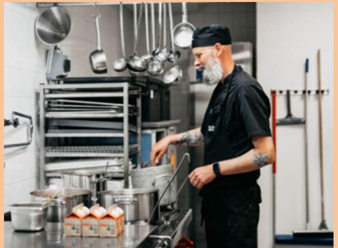
Verksamheten ResursRätt möjliggör att fler får tillgång till näringsriktiga måltider och minskar samtidigt det egna svinet i MatRätt-butiken i Rannebergen.

Räddningsmissionen gör bedömningen att deras butiksvinn är väldigt lågt för en social matbutik – omkring 1,5 procent. ResursRätt är en stor anledning till det, då det ger matvarorna en tredje chans att hamna på tallriken, snarare än i matsorteringen.